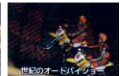
世紀のオードバイショー