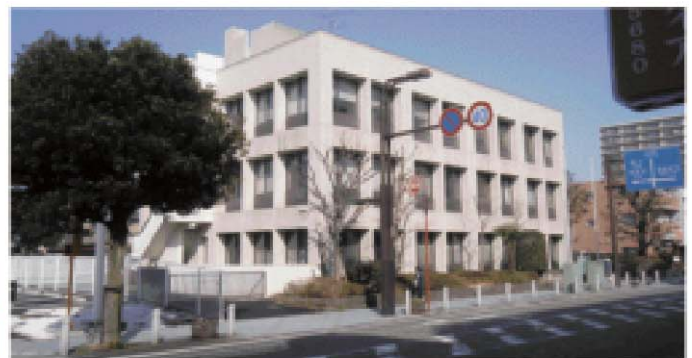
旧県税事務所外観