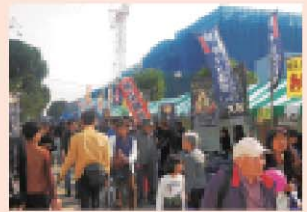
～ご協賛いただいた企業の皆様、誠にありがとうございました～