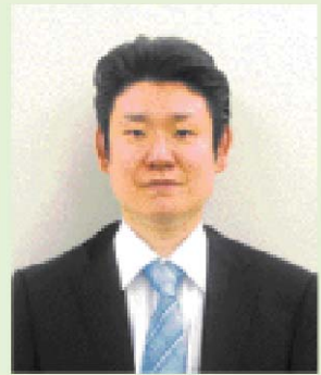
経営支援チーム配属