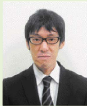
経営支援チーム配属