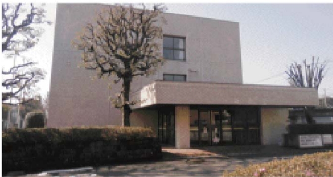
旧県税事務所入り口