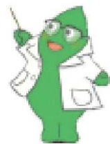
大和市イベント キャラクター『ヤマトン』