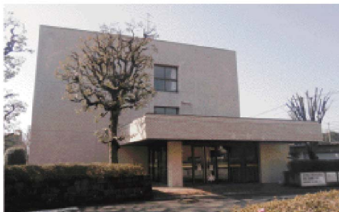
旧県税事務所入り口