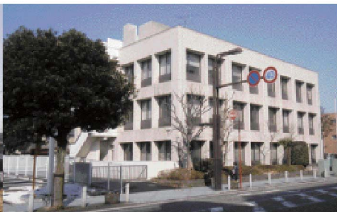
旧県税事務所外観