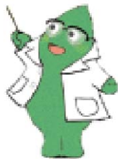
大和市イベントキャラクター「ヤマトン」