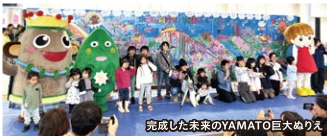
完成した未来のYAMATO巨大めりえ