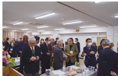
多くの参加者で賑わう会場