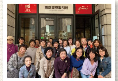
皆様全員ニコニコ。勉強してきました