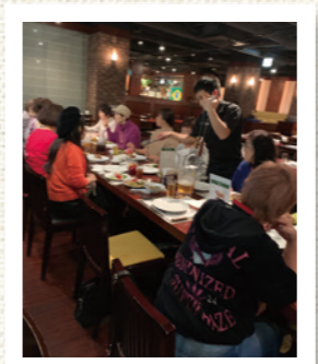
熱々シュラスコの前にサラダをたくさん。お肉でおなかいっぱい