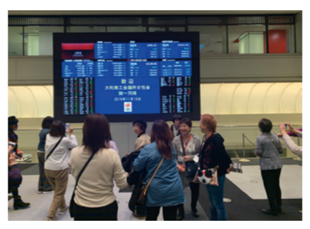
証券取引所で大歓迎。パネルにおどろき!