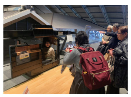
江戸時代にタイムスリップ