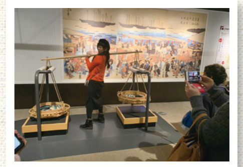
昔の商人さんのご苦労がわかります