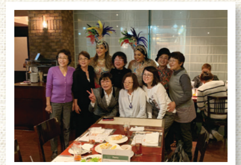
本場のサンバショーに惚れ惚れ。感激!