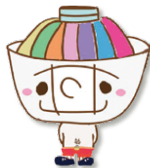
大和のドン公式キャラクター「ヤマドン」

平成31年1月11日(金)から2月28日(木)まで開催した「大和のドン」が日本商工会議所発行の「会議所ニュース(平成31年2月11日発行)」に掲載されました。