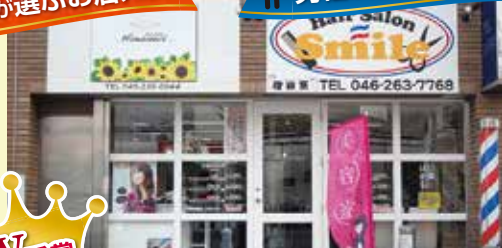
理容 美容 スマイル・ひまわり