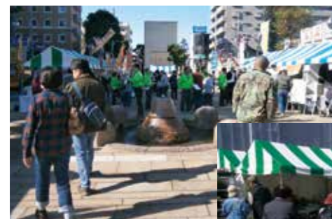
▲西側プロムナード会場

大和商工会議所会場では、青年部による「わくわく☆WORK こどもお仕事チャレンジ」や、運輸倉庫業部会によるチョコQゲームやドライブシュミレーター、飲食業部会と青年部イベント企画委員会コラボによるノベルティ配布やソーセージ・ビール販売、サービス業部会・異業種交流会の会員企業PRコーナーや野点コーナー等の出店が行われ、多くの来場者を楽しませました。