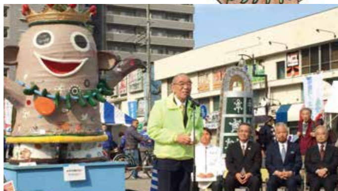
セレモニー(実行委員長による挨拶)

中央1号公園会場では、農産物即売会やミニ牧場など様々なイベントが行われ、多くの来場者が訪れました。今年も多数のご協賛、ご協力いただきました企業、個人、団体の皆様、誠にありがとうございました。