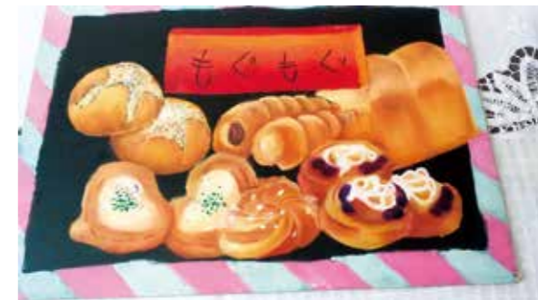
▲孫が描いたモグモグパン

最近、私はAI(人工知能)に関心を持っています。 「AIは人間の生活を豊かにしてくれる反面、人間の働ける場はどんどん無くなってしまおうのでしょうか?」「AIに人間が勝つには…?というより、AIにできないことは?」そんな予想をしたりして。 傍にいた、夫がこの原稿を覗き込んで、ポツリと言いました。 「よそを反対に読んだら?」…「よそう…うそよ…なんだ!」あんまり将来を予想しても、うそよなら今を明るく、楽しく、コミュニケーション!それが、どんな関係でも大切なんですね。