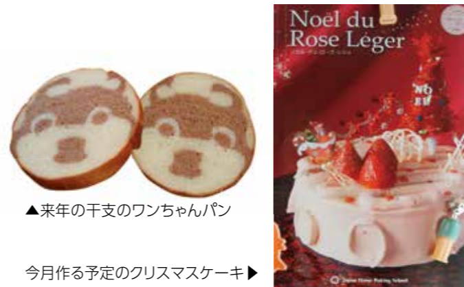
▲来年の干支のワンちゃんパン

主人の仕事柄、わが家では時々、未来予想をします。 「孫達が大人になったら、どんな世の中になっているだろうか?」 「今の子供達が赤電話を知らないように、スマホを知らない子供達の時代になるのかしら?」 統計によれば、日本では、今年7歳の子供達は100年後(107歳)に同窓会を開いても半数の同級生は生きているそうです。(出生率は判りませんが…) 私のパン教室は多くの方々に支えられ30周年を迎えました。 開設時、生徒さんだった新婚さんには、もうお孫さんがいます。 今月はクリスマスケーキと平成30年の干支のワンちゃんパンを作ります。 毎月、生徒さん達はワイワイ・ガヤガヤ、笑顔あふれ、焼きたてのパンを頬張る顔は幸せそのものです。