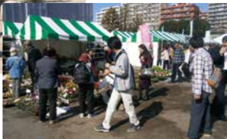
中央一号公園会場▶