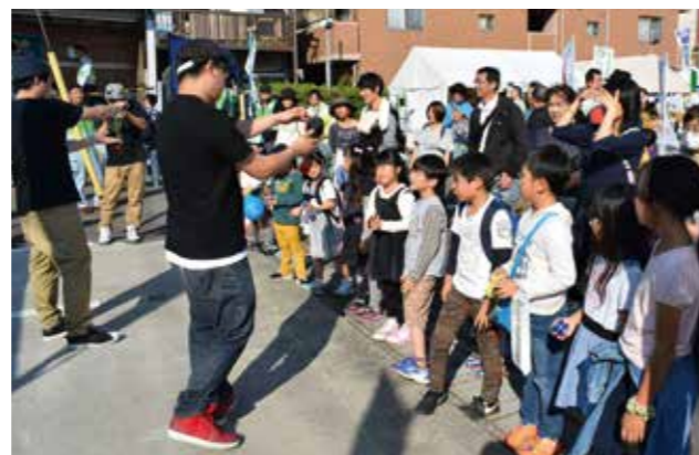
▲大和商工会議所会場