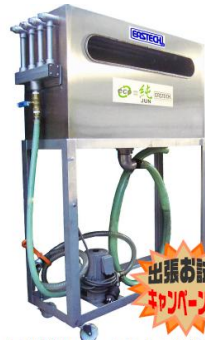
■切削油・クーラントろ過装置 EJV-40

イスタン技研株式会社グループ4社は合金製造・フィルター製造・配電部品用樹脂切削加工・電気接点製造等を行っており、自動車・電機・鉄道・航空等、国内の幅広い産業分野に各種製品を提供しております。